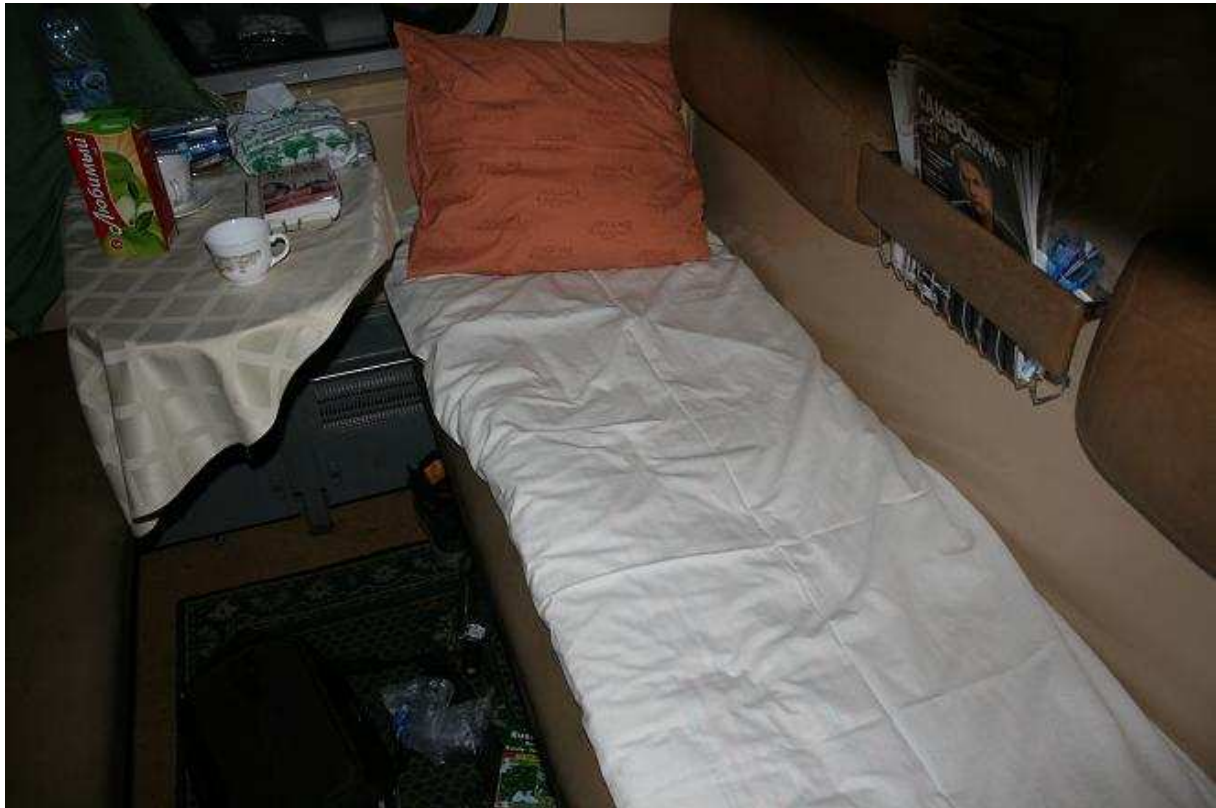
M'n bed in de coupé. Zelfs op het kussensloop staat "Rossia"

Na het eten nog een paar vodkaatjes, en daarna lekker slapen.