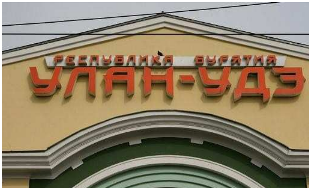
Treinstation van Oelan Oede

Улан-Удэ binnen. Het is er mooi, niet echt druk op het perron.