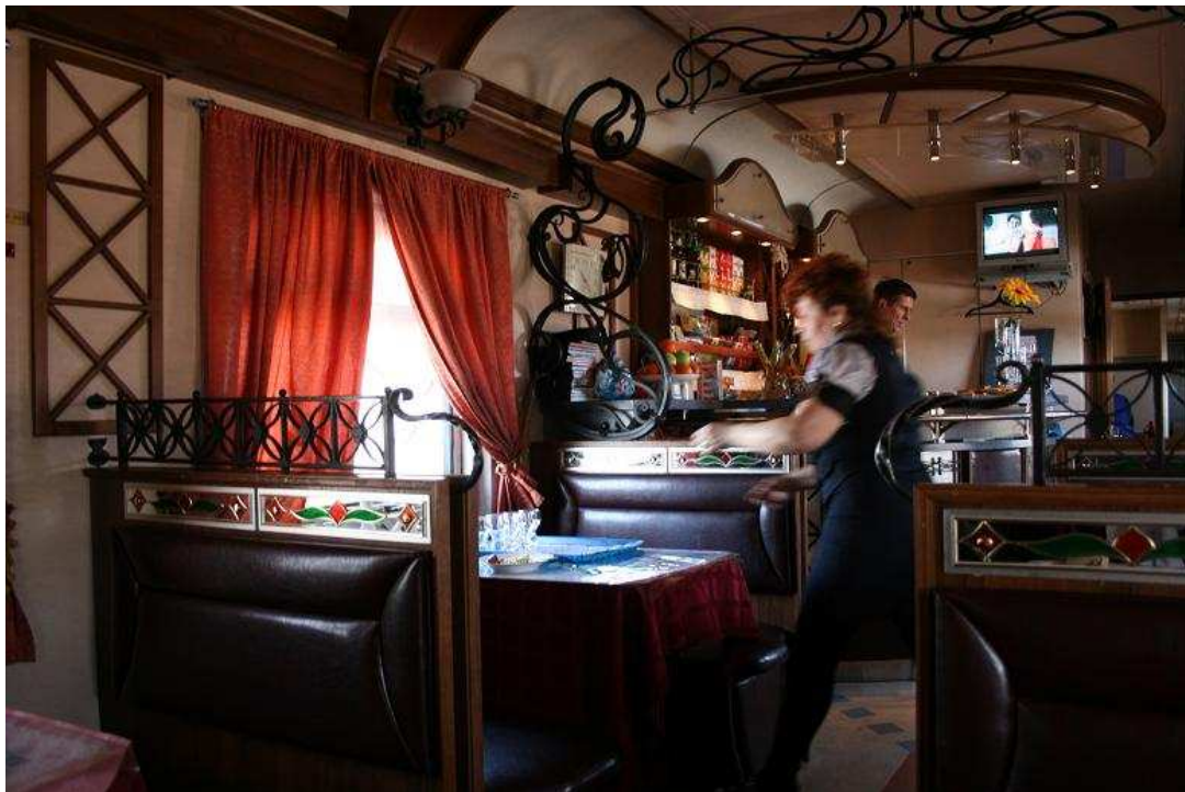
Restauratiewagon in de "ROSSIA"

In de restauratie hangt een ongedwongen sfeer, die je eigenlijk zelf zou moeten proefen om het te begrijpen.