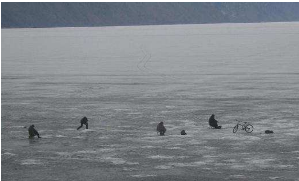
IJsvissers op het Baiaklmeer

Het zijn echte “viswijfies” want de één schreeuwt nog harder als de ander. Reizigers kopen wat vis. Als de deur word gesloten en wij weer vertrekken, is de hele wagon vergeven van de vislucht. Maar het ruikt heerlijk! Ik hoop dat de foto’s vanuit de trein een beetje lukken, want de ramen zijn aan de buitenkant niet al te schoon. De omgeving is prachtig, zo veel natuurschoon. Aan de linkerkant nog steeds het meer, rechts de besneeuwde bergen. Wat is Nederland toch klein en ver weg denk ik als ik van het uitzicht geniet.