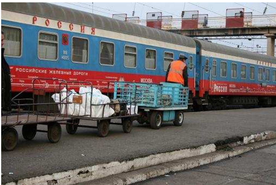
Perron smorgens vroeg in Belogorsk

Een uur later stoppen we in Belogorsk, 30 minuten lang frisse lucht happen.