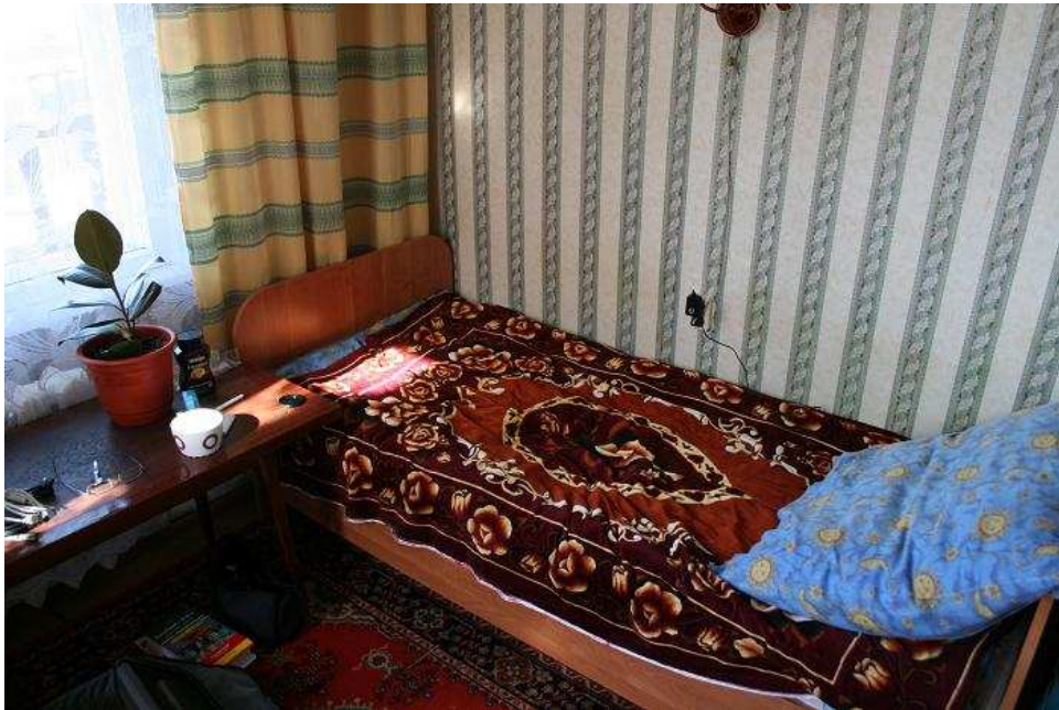
Slaapkamer in Listvianka

Moe van het wandelen, de frisse lucht en de belevenissen houd ik het voor vandaag voor gezien en ga naar huis.