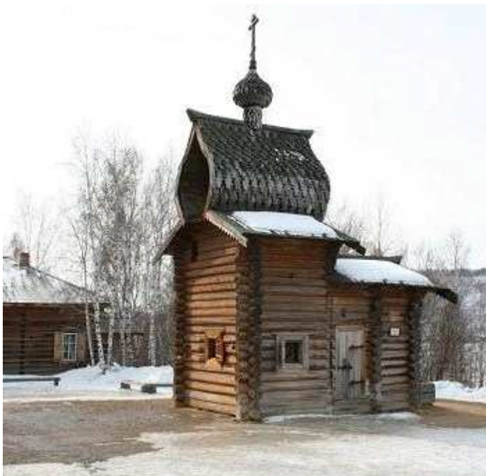
Openluchtmuseum in Taltsi