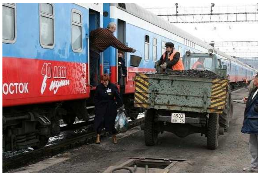
Nieuwe steenkolen voor de Samovar

Om 16u16 stoppen we op het station van Amazar Амазар .