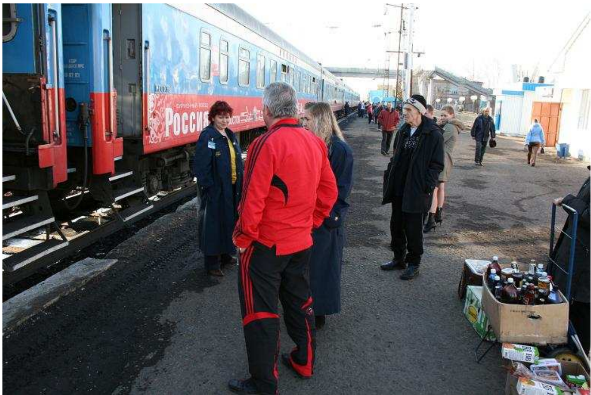
Gezellig druk op het perron

We stoppen op het station van ИЖАНСКА . Op het perron staan weer plaatselijke mensen die hun koopwaren uitgesteld hebben. Bij hun kun je brood, bier, frisdrank en andere benodigdheden voor onderweg kopen.