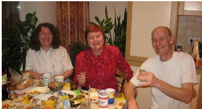
“Thuis” natafelen in Krasnojarsk

Rond 18u00 ben ik “thuis”, weer met lijn 83. Kosten: 10 RUR, ongeacht de afstand of tijd die je in de bus zit. De prijs staat van buitenaf goed leesbaar op het zijraam geplakt.