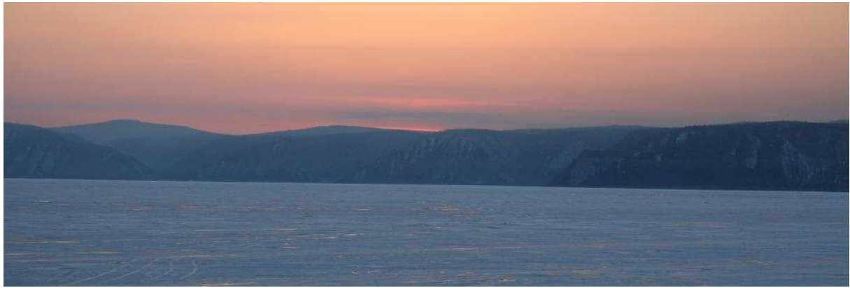
Zonsondergang aan het Baikalmeeer