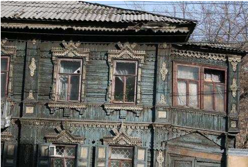
Oud huis in het centrum van Krasnojarsk

Uit de luidsprekers op straat, die overal hangen, klinkt vrolijke volksmuziek. Wat ook opvalt is dat de straten netjes schoon zijn, geen rotzooi. Maar wel overal afvalbakken.