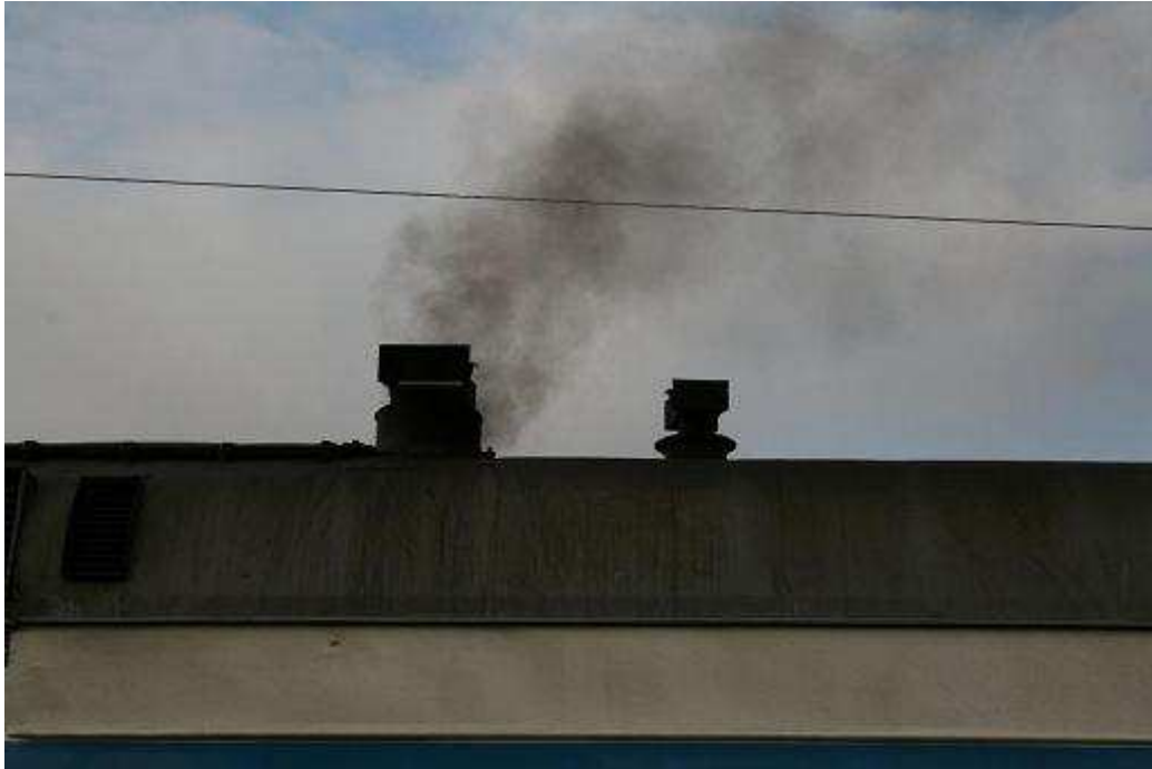
Schoorsteen van de Samovar. Op iedere wagon staat er een

De schoorsteen van de samovar braakt zwarte rook uit.