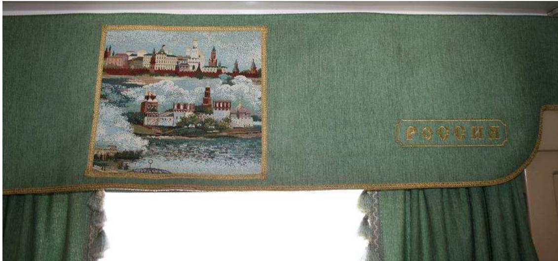
Gordijnen in de РОССИЯ (Russia)

Plaatsbewijs en paspoort controle bij de provodnitsa, dan instappen. We nemen afscheid en ik bedank de mensen voor hun gastvrijheid. Dit is echt “de echte ROSSIA”! Mooie gordijnen met borduursels van gebouwen en steden.