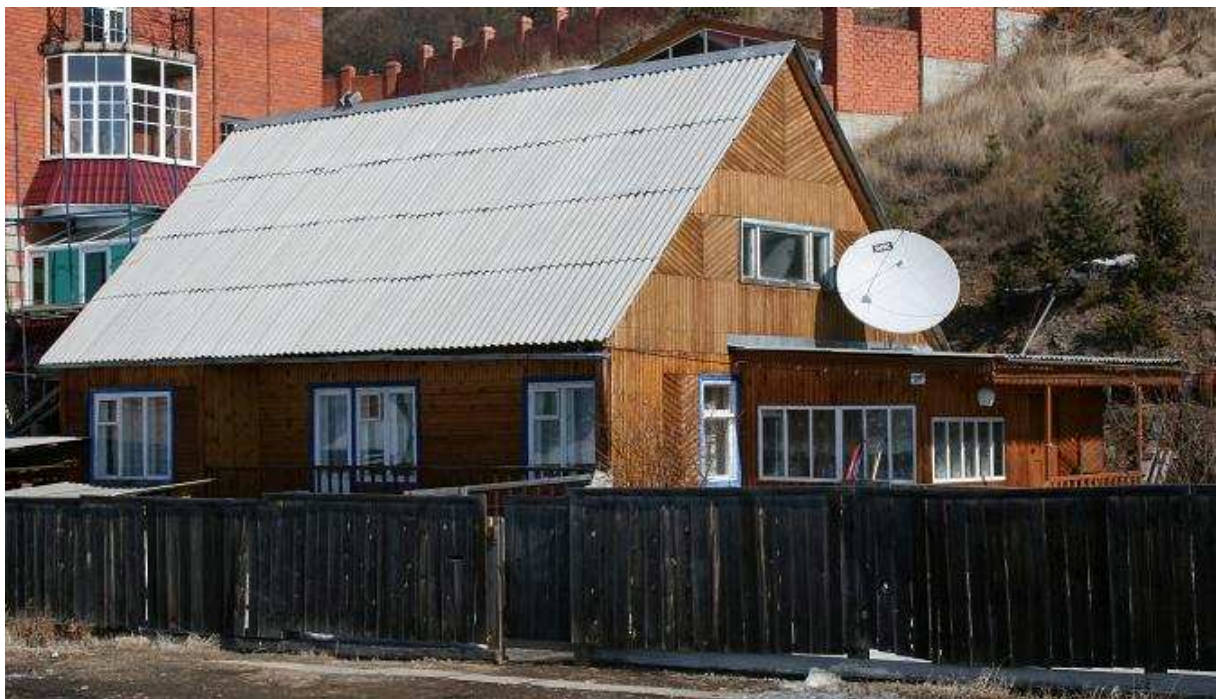
“Mijn huisje” (Homestay) in Listvianka aan het Baikalsee

Maar omdat het toch aardig koud is, besluit ik even naar huis te lopen en daar dan een koffie te drinken. In de keuken staat een heetwaterketel, waar ik met mijn oploskoffie een bakje uit tap.