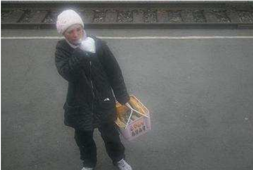
“Mandje vol vis”

Als we om 9u30 een paar minuten stoppen op een stationnetje word de trein bestormd door een aantal vrouwen. Zij hebben mandjes en tassen vol met “Omul” vis.